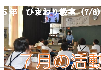
5年 ひまわり教室 (7/6)