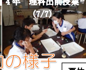
4年 理科出前授業 (7/7)