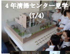
4年清掃センター見学 (7/4)