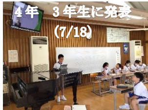
4年 3年生に発表 (7/18)