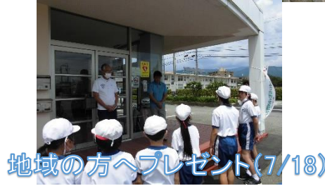
地域の方へプレゼント (7/18)