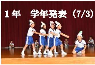
1年 学年発表 (7/3)