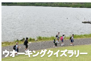
ウォーキングクイズラリー