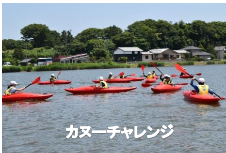
カヌーチャレンジ

5年生の保護者の皆様、荷物準備やお迎え等のご協力をいただき、ありがとうございました。