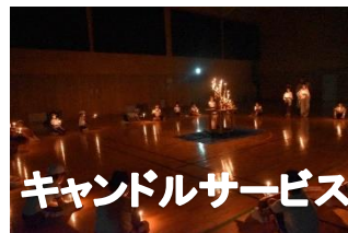
キャンドルサービス