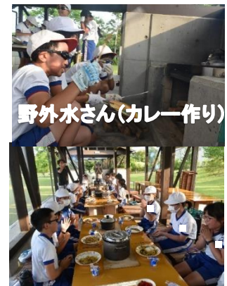
野外水さん(カレー作り)