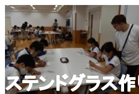
ステンドグラス作り